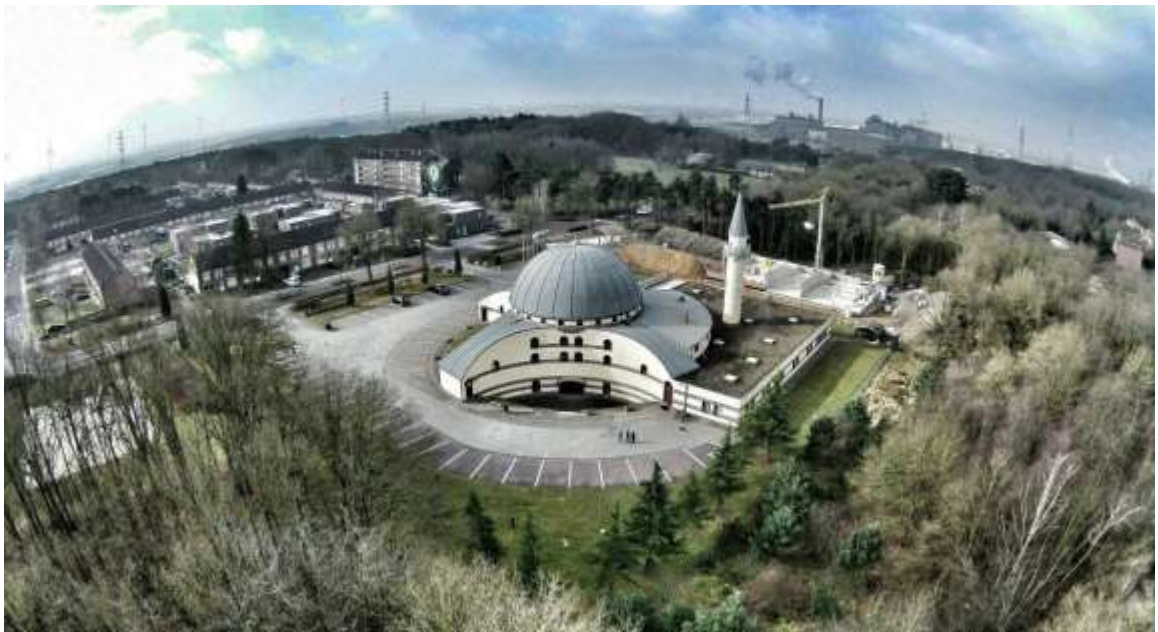
مسجد يونس أمير

المرحلة الثالثة: مرحلة الاعتراف الرسمي بالمساجد: